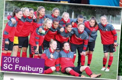
2016 SC Freiburg