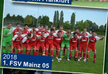
2018 1. FSV Mainz 05