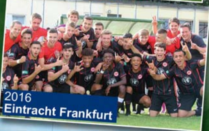
2016 Eintracht Frankfurt