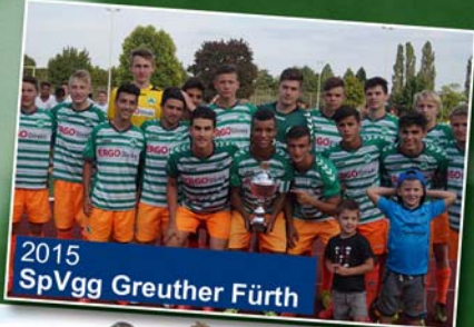
2015 SpVgg Greuther Fürth