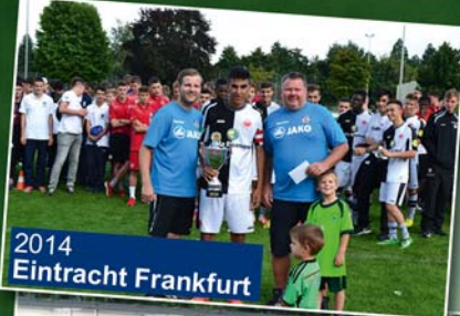
2014 Eintracht Frankfurt