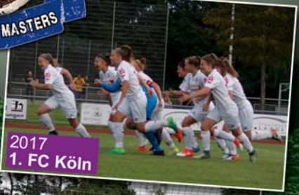
2017 1. FC Köln