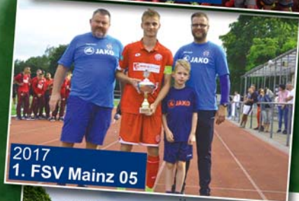
2017 1. FSV Mainz 05