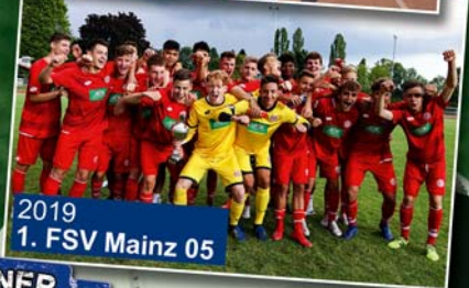
2019 1. FSV Mainz 05