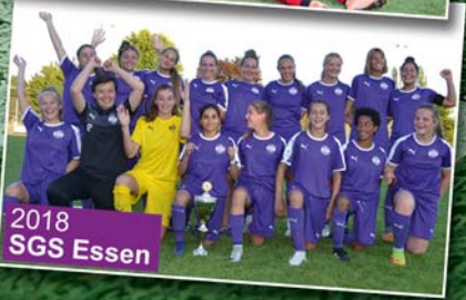
2018 SGS Essen